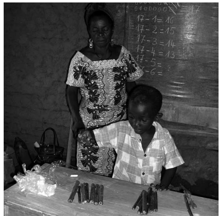
In kreativer Art werden Bambusstäbe in den Rechenunterricht einbezogen, denn für teures Schulmaterial reicht das Budget nicht aus

Ein wichtiger Aspekt ist eine Didaktik des schülerzentrierten Unterrichtes. Das heisst, es wird die Eigenständigkeit des Kindes gefördert bzw. der oft anzutreffende Frontalunterricht mit einem «Nachplappern» des Schulstoffes vermieden. Die LehrerInnen werden auch dazu angehalten, alle Schüler - die Lernschwachen wie die Lernstarken - in den Unterricht miteinzubeziehen. Natürlich stellt dies bei den teilweise grossen Klassen eine besondere Herausforderung dar.