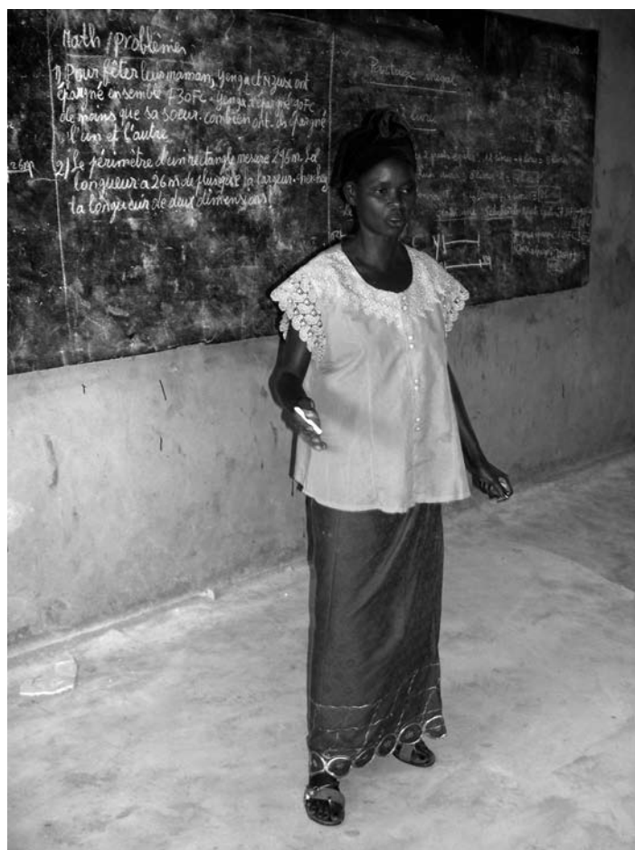
Die Lehrer der CEK werden weitergebildet und vermitteln ihre Kenntnisse an Kollegen

und Einkommen hat Staatspräsident Kabila in seiner Antrittsrede im Dezember 2006 den Begriff der «fünf Baustellen» ausgegeben. Neben den «traditionellen» Gebern (Weltbank, EU-Kommission, bilaterale Geberstaaten wie Deutschland, Grossbritannien, USA etc.) engagiert sich hierbei verstärkt auch die Volksrepublik China, allerdings nicht in Form «klassischer» Entwicklungspolitik, sondern mittels kommerzieller Verträge, die als Gegenleistung für